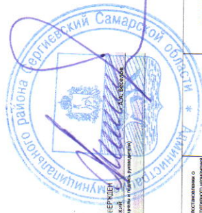
ПЛАН проведения плановых проверок на 2020

УТВЕРЖДЕН Глава муниципального района Сергиевский Самарской области (подпись, инициалы и фамилия, расшифровка) от _____